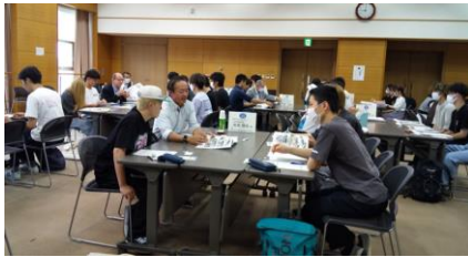
グループディスカッション