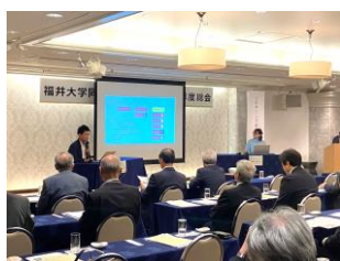
シンポジウム：リスクリグ「デジタル化・DX実践講座」成果報告と意見交換