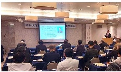
講演会：福井大学活用のススメ