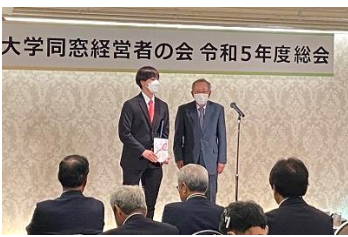
「福井大学大学祭（越祭）への緊急支援支援」 目録贈呈